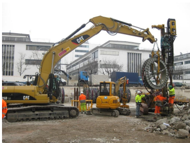
Einbauen der Testanker

Die komplette Baumaßnahme ist mit einem umfangreichen Mess- und Überwachungskonzept ausgestattet, um die laufende Produktion mit Laboreinrichtungen in dem direkt angrenzenden Bestandsgebäude aufrecht erhalten zu können. Um die Setzungen und Neigungen am direkt benachbarten Hochhaus zu begrenzen, wurde dieses mit einer Manschettenrohrinjektion unterfangen. Sowohl die Temporär- als auch die Restwasserhaltung wird über eine automatisch geschaltete Trübungs- und pH-Wert-Messung geführt, bei Einhaltung aller definierten Grenzwerte wird das anfallende Wasser automatisch in die Vorflut zum Rhein geleitet, andernfalls in die städtische Kanalisation. Um im Endzustand eine Grundwasserumströmung zu erreichen, werden auf der Nord- und Südseite der Baugrube (Fließrichtung des Grundwassers) jeweils 4 St. Horizontalfilterbrunnen durch die Verbauwand hergestellt. Das Grundwasser wird über diese Brunnen im Norden entnommen, durch das fertiggestellte Bauwerk geführt und im Süden wieder an den Baugrund abgegeben.