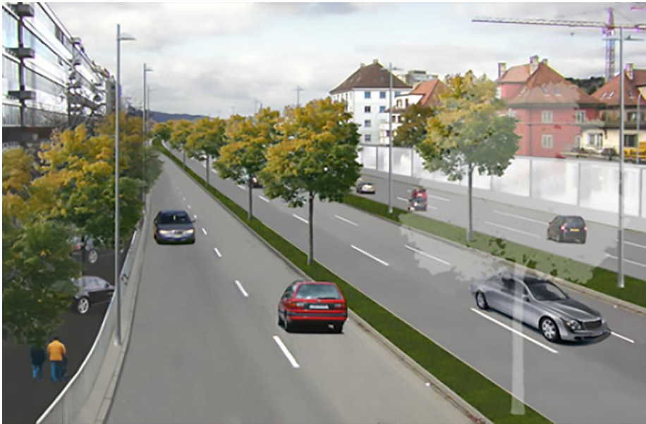
Visualisation de la jonction autoroutière « N01/36 Schlieren-Europabrücke » à Zurich-Grünau.