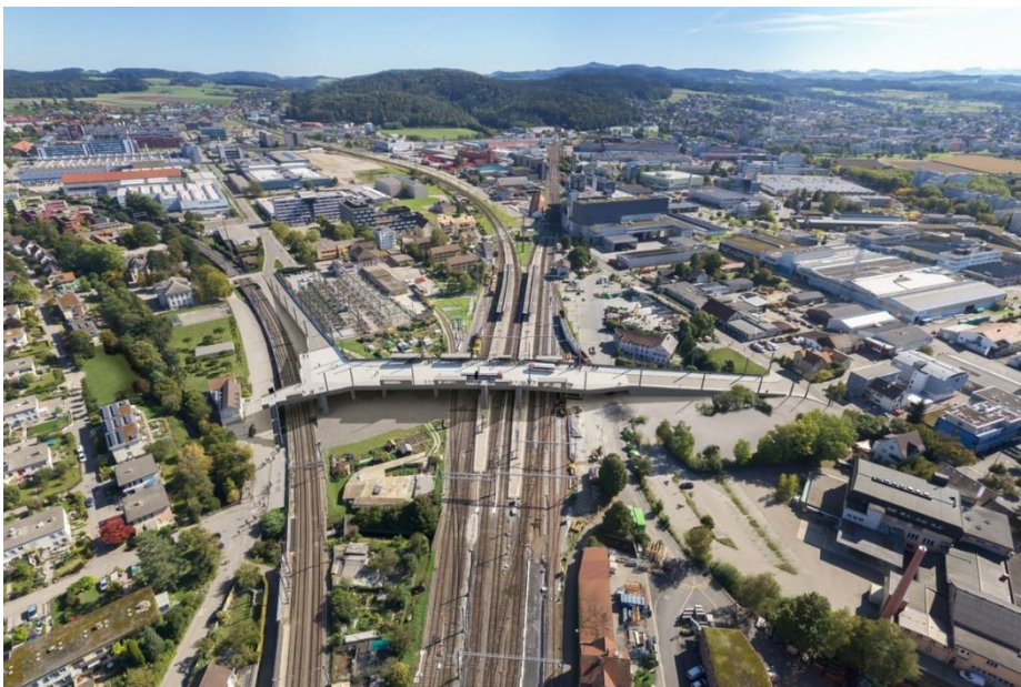
Futur pôle de transports à Winterthur Neuhegi : la traversée de Grüze.